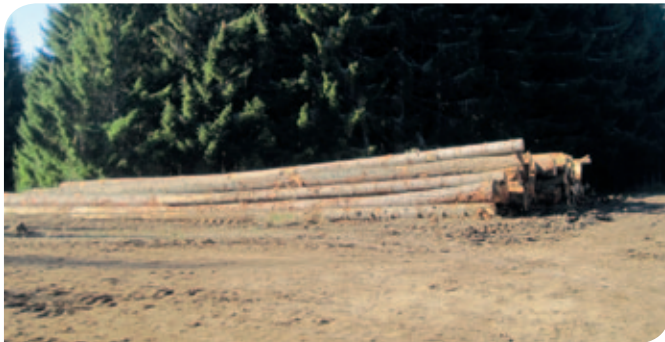
Création de place de dépôt