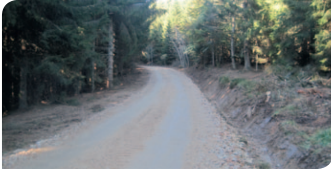
Création de desserte dédiée à la gestion forestière