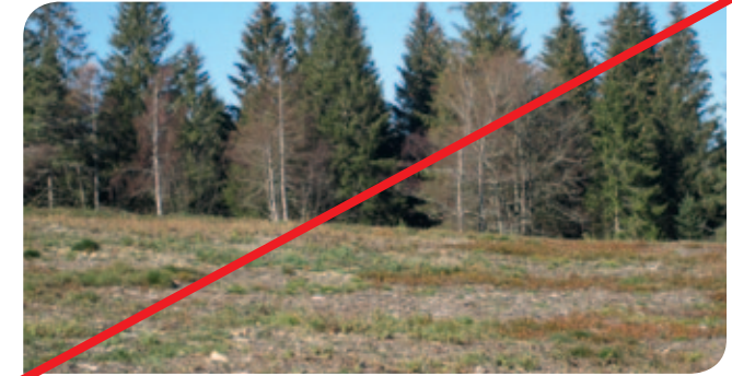
Défrichement pour mise en prairie ou culture