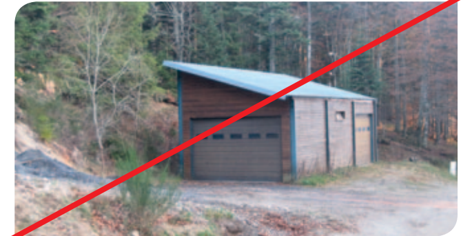
Bâtiment, infrastructure (maison, hangar, garage, équipement équestre, parking, ...)