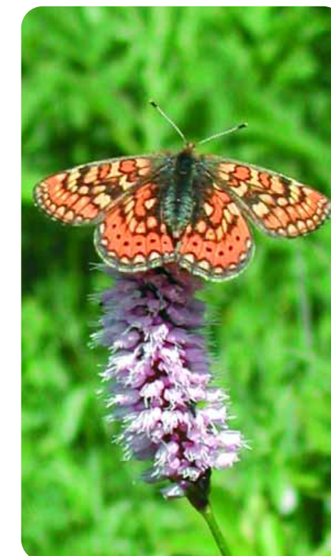
le Damier de la Succise fréquente plutôt les milieux humides du site Natura 2000

Le comité de pilotage (COFIL*) du site de la Chaîne des Puys a été réuni par le Préfet du Puy-de-Dôme en octobre 2007 et a élu le Maire d'Orcines à sa présidence. Il a choisi le Parc naturel régional des Volcans d'Auvergne pour rédiger le document d'objectif (DOCOB*).