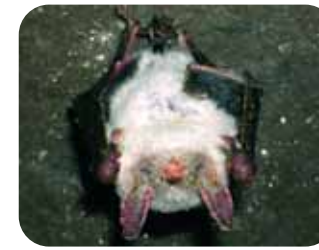
Des mammifères qui gagnent à être mieux connus : au moins 6 espèces de chauves-souris (ici, Oreillard et Grand Murin) visées par Natura 2000 fréquentent la Chaîne des Puys.