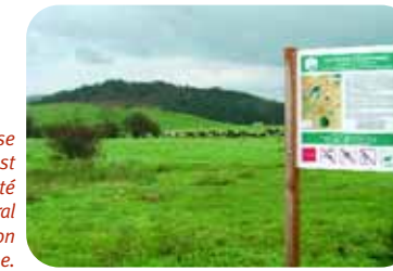
La Narse d'Espinasse est classée en Arrêté Préfectoral de Protection de Biotope.