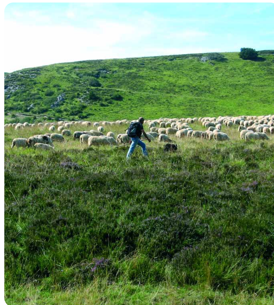
Pastoralisme, paysage et biodiversité sont indissociables dans le Site Natura 2000 de la Chaîne des Puys

Ainsi, le COFIL a décidé que les groupes de travail se réuniront par thématiques et à 2 reprises. Toutes les personnes concernées par une thématique sont invitées à participer à ces groupes de travail : propriétaires, chasseurs, pêcheurs, agriculteurs, pratiquants sportifs, forestiers, acteurs touristiques, conseils municipaux, etc. Ils peuvent se faire connaître auprès du Parc naturel régional des Volcans d'Auvergne.