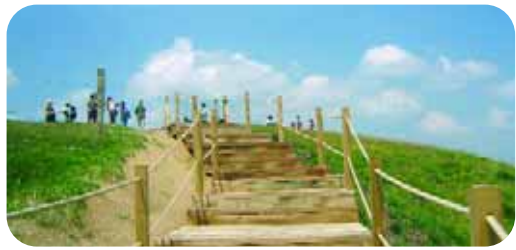
L'aménagement des sentiers (ici le Pariou) dans le cadre du Site classé rejoint complètement les enjeux du site Natura 2000.