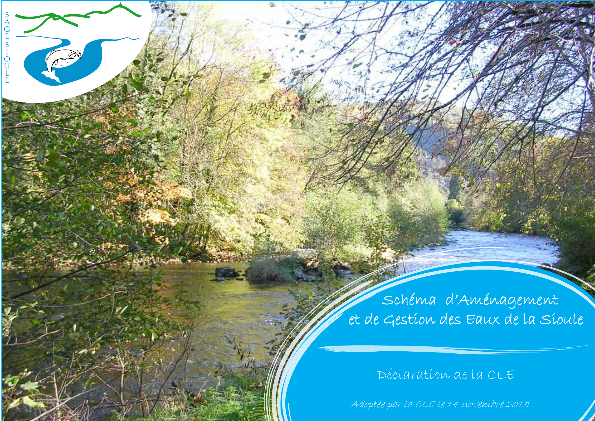
Schéma d'Aménagement et de Gestion des Eaux de la Sioule