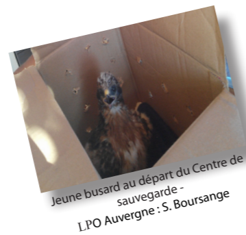
Jeune busard au départ du Centre de sauvegarde - LPO Auvergne : S. Boursange

Cette année, une attention plus particulière aux luzernes a été portée, 3 nids ont été découverts sur les communes d'Apchat et de Rentières, dont 2 dans le même champ. Début juin lors de la fauche, les œufs n'ont pas encore éclos, la femelle n'a pas encore un très grand attachement à son nid, une protection rapprochée est donc impossible. Il faut alors laisser une grande surface autour du nid (environ 100 m 2 ) pour être certain que la femelle revienne couvrir ses œufs.