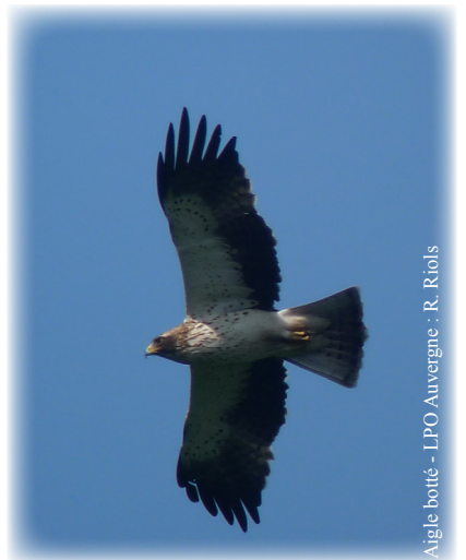
Aigle botté

L'Aigle botté est un rapace peu fréquent en Europe, il est surtout présent en Espagne. En France, l'espèce se répartit des Pyrénées aux Ardennes en passant par le Massif central. En Auvergne, nous estimons qu'il y a entre 65 et 130 couples, ce qui est très faible même pour un rapace. Dans le site Natura 2000, un seul couple d'Aigle botté était connu jusqu'en 2013, dans les gorges boisées de Courgoul. En 2014, les suivis réalisés pour le Busard cendré ont permis de découvrir la nidification de cet aigle dans une autre pente boisée à proximité d'Ardes sur Couze. Cette découverte est une bonne nouvelle pour la biodiversité !