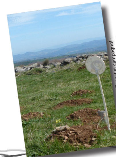
Piège Topcat et campagnol

Cette année, le piégeage a été réalisé dès la fin de l'hiver et au début du printemps, puis dès que la fauche a été terminée, c'est-à-dire mi-juillet.