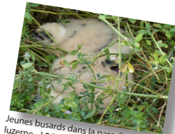
Jeunes busards dans la parcelle de luzerne

Les deux nids du même champ ont pu être protégés, les œufs du troisième ont dû être amenés au centre de soin. Malgré la protection, un nid a été prédaté, l'autre a permis d'amener 2 jeunes busards à l'envol. Un seul œuf a éclos au Centre de sauvegarde, le jeune a été réintroduit dans un autre nid de busard cendré de Haute-Loire, il a pris son envol quelques jours plus tard.