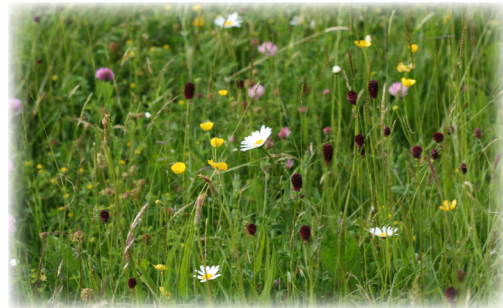
Prairies des Couzes

Le Syndicat Mixte de la Vallée de la Veyre et de l'Auzon, en partenariat avec la LPO Auvergne, a déposé un dossier de candidature pour son territoire auprès du Conseil régional d'Auvergne. Un autre dossier a été déposé par la LPO Auvergne sur la partie sud du site Natura 2000. Enfin pour le territoire central du site il faut attendre la mise en place des contrats territoriaux des couzes Pavin et Chambon afin de pouvoir déposer un dossier plus solide et plus facilement acceptable par le Conseil régional. Le projet du SMVVA a été retenu, sous réserve d'un avis positif de la Commission Régionale Agro Environnementale et climatique ainsi que des disponibilités budgétaires, il devrait permettre de proposer des MAEC dès 2015 aux agriculteurs de ce territoire.