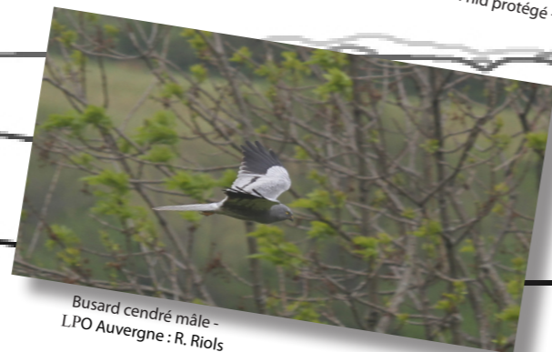
Busard cendré mâle