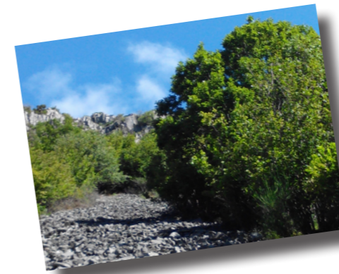
RNN de la Jaquette

En Auvergne les vautours sont de nouveau observés depuis les années 2000. Ils viennent du sud du Massif central et des Pyrénées, et peuvent même aller jusqu'en Belgique. Les vautours sont des oiseaux charognards, c'est-à-dire qu'ils se nourrissent de cadavres. Exceptionnellement il peut arriver que des vautours commencent à se nourrir d'animaux incapables de bouger et restant immobiles même lors de leur approche. Les capacités digestives de ces oiseaux sont telles qu'elles permettent de digérer les morceaux de carcasse et les microbes ce qui empêche efficacement la propagation des maladies. En 2014, il y a eu 22 observations de vautours dans le site Natura 2000 du Pays des Couzes, dont une de 31 individus à Dausat-sur-Vodable au mois de juin. En Auvergne, il y a eu un total de 113 observations réalisées et le maximum d'individus notés est de 40 (La Chomette 43). Ces oiseaux sont uniquement présents d'avril à septembre dans notre région.