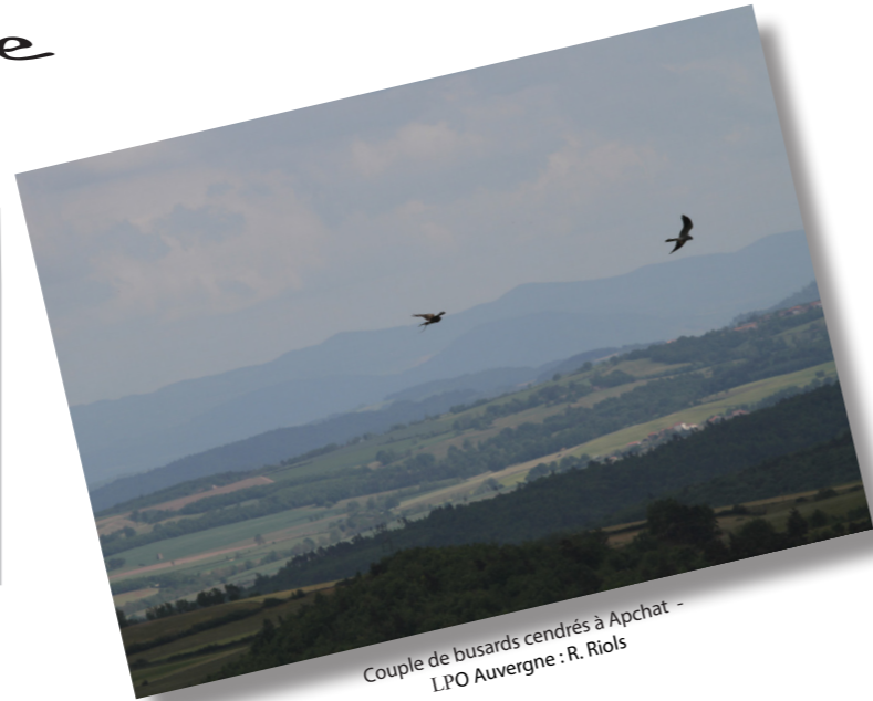
Couple de busards cendrés à Apchat

Jusqu'à présent la nidification du Busard cendré était plutôt identifiée dans les parcelles de céréales dans le site Natura 2000. Les moissons se faisant à partir du mois de juillet les interventions se faisaient, si nécessaire, sur des nids avec des oisillons assez grands et sur des surfaces restreintes autour du nid (environ 1 ou 2 m 2 ).