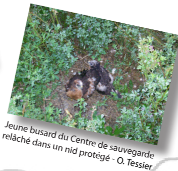
Jeune busard du Centre de sauvegarde relâché dans un nid protégé - O. Tessier