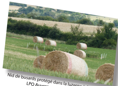
Nid de busards protégé dans la luzerne à Apchat

Les deux nids du même champ ont pu être protégés, les œufs du troisième ont dû être amenés au centre de soin. Malgré la protection, un nid a été prédaté, l'autre a permis d'amener 2 jeunes busards à l'envol. Un seul œuf a éclos au Centre de sauvegarde, le jeune a été réintroduit dans un autre nid de busard cendré de Haute-Loire, il a pris son envol quelques jours plus tard.