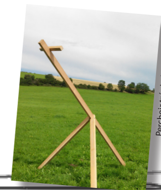
Perchoir trépied

Les conditions météorologiques et de pousse de l'herbe ont été exceptionnelles cette année, les fauches ont été très tardives, l'herbe a poussé régulièrement et même en automne, ce qui a facilité la reproduction du campagnol terrestre mais pas le piégeage. Sur ces deux campagnes 4194 campagnols ont été piégés.