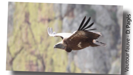
Vautour fauve - D. Pagès

Au sein du périmètre de la Réserve naturelle nationale du Rocher de la Jaquette, les parcelles de la section de Badenclaud ont été engagées en 2012. Le Conservatoire d'Espaces Naturels d'Auvergne, nouveau propriétaire des parcelles de la Réserve s'est engagé dans la démarche cette année avec le gestionnaire de la réserve, le Syndicat mixte du Parc naturel régional des Volcans d'Auvergne.