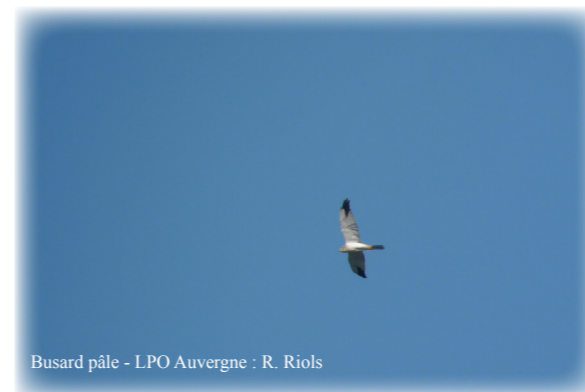
Busard pâle

Le 20 septembre 2014, un Busard pâle a été observé par deux personnes à Saint-Nectaire. Cette espèce se reproduit dans les plaines herbeuses, les steppes sèches ou arborées de l'Ukraine et du sud de la Russie jusqu'au nord-ouest de la Chine et l'ouest de la Mongolie. Elle passe l'hiver en Inde et en Afrique. Il est donc très rare d'observer ce bel oiseau dans notre pays.