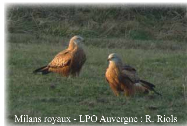
Milans royaux

Les actions menées cette année se sont concentrées sur les Mesures agri environnementales territorialisées (MAET), la Charte Natura 2000, la recherche et la protection du Busard cendré et enfin la création d'un site web. Certaines de ces actions vous sont présentées à l'intérieur de ce bulletin d'information.