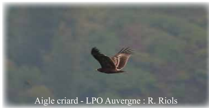
Aigle criard

Cette espèce est très rare en France, elle niche de la Pologne à la Sibérie orientale. Depuis les années 80 il n'y a en moyenne pas plus de 5 individus observés chaque année dans notre pays. En 2008 un jeune Aigle criard estonien, dénommé Tönn, a été équipé d'une balise GPS. La transmission de ces données de localisation montre qu'il est passé le 6 avril 2010, à 11h, au-dessus de la commune d'Ardes sur Couze.