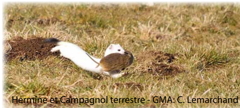
Hermine et Campagnol terrestre

La thématique principale sur laquelle nous voulons travailler et apporter des solutions est la lutte contre le Campagnol terrestre. Nous voulons travailler avec tous les acteurs concernés par cette problématique et profiter des soutiens financiers que peut apporter Natura 2000 pour mettre en place une lutte respectueuse de l'environnement grâce aux actions prévues dans le Document d'objectifs.